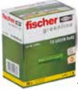
Tipi SX GREEN u kutiji