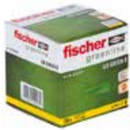
Tipi za gas-beton GB GREEN u kutiji