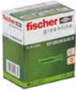
Tipl univerzalni UX GREEN u kutiji