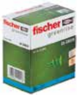
Tipl za gips-karton ploče GK GREEN u kutiji