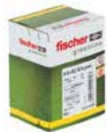
Tipl udarni N GREEN u kutiji